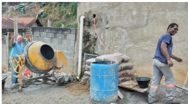
Werken aan de bouw van de garage

We bouwen ook een garage voor de auto's in Cena, met behulp van materialen van het gemeentehuis. Het plan is om de 11 de klaar te zijn, de dag vóór vertrek naar Nederland, maar