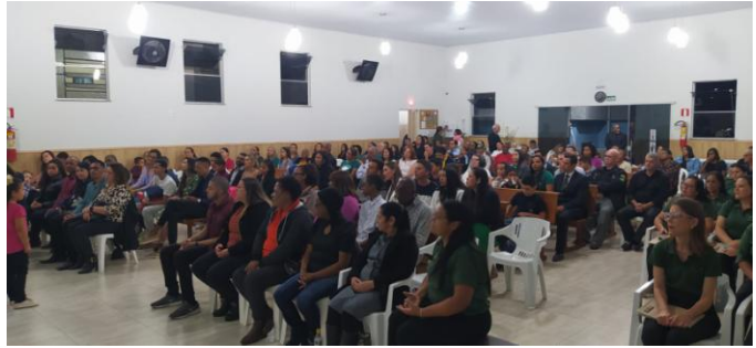
Speciale dienst met de Levieten

Op 2 en 3 september vierden we het achttiende jaarfeest van de "Levitas", onder leiding van pastor Ismaël. We