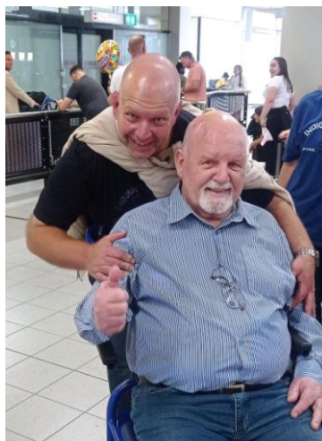
Aangekomen op Schiphol

Nederland, proberen we vervanging voor hen te vinden. Op 2 augustus ben ik naar het onderwijskantoor gegaan om te vragen of iemand kan invallen voor Karin, die het spelletjeswerk met de kinderen doet. Ze zouden me helpen, maar vandaag, 6 september, wacht ik nog steeds. Bid dat ze ons tijdig een competent personeelslid sturen. Nu de winter afloopt en het weer drukker wordt op Cena, omdat de kinderen minder vaak verkouden thuis zitten, is zo iemand des te meer nodig.