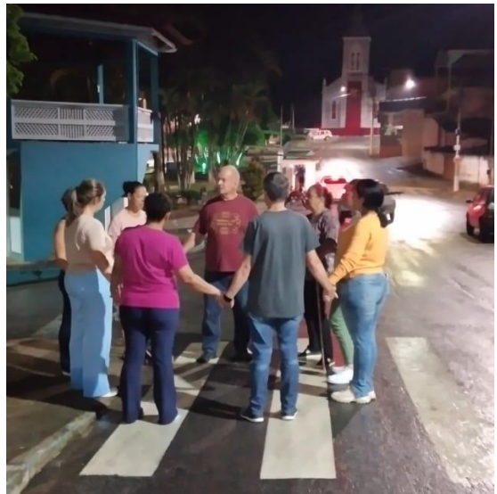
Gebed en evangelisatie op Goede Vrijdag

Rond de Paasdagen , op Goede Vrijdag 29 maart, heeft de gemeente gebedswandelingen gehouden in verschillende delen van de stad. Tegelijk gaven we mensen die langskwamen een kaartje met de woorden: "Het was voor jou dat Jezus zijn laatste adem uitblies". Zo werden zij eraan herinnerd dat Jezus voor ieder van hen stierf aan het kruis.