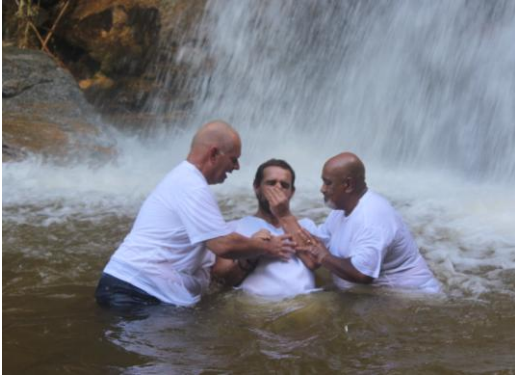
Doopdienst bij de waterval

We konden daar de aanwezigheid van God voelen toen we zagen hoe onze broeders publiekelijk hun geloof beleden in één God en in Jezus, de enige verlosser. Wij bidden dat onze gedoopte broeders zullen blijven groeien in de genade en kennis van God.