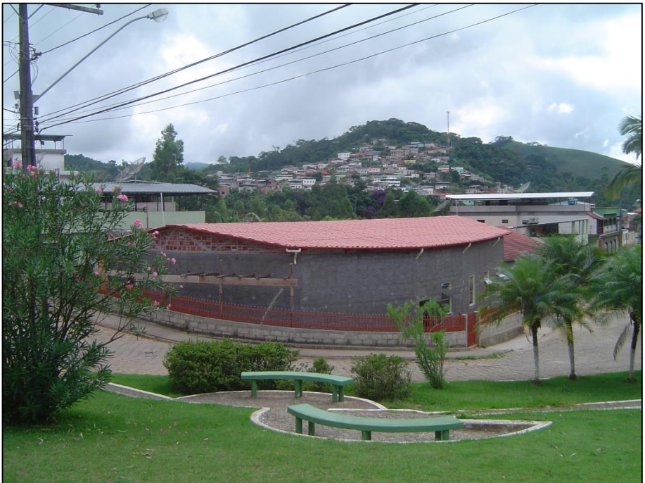
Foto van de buitenkant van de kerk in Santa Bárbara do Tugúrio

Zodra de binnenkant klaar is, gaan we een speciale feestelijke dankdienst houden en de kerk dan al in gebruik nemen. De buitenkant van het gebouw kan afgewerkt worden als er voldoende financiën voor zijn.