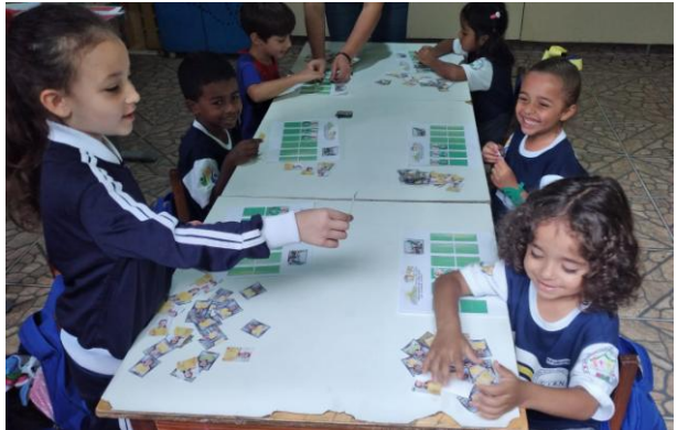
Kinderen op CENA bezig met voetbalplaatjes

Rond deze tijd was ook het WK voetbal, en Brazilië is echt een voetballand. Daarom besteedden we daar veel aandacht aan. We versierden de ruimtes, maakten wandborden met de vlaggen van de deelnemende landen, en we keken samen naar de wedstrijden die plaatsvonden wanneer de kinderen hier waren. Dit was erg leuk en bovendien leerzaam voor iedereen.